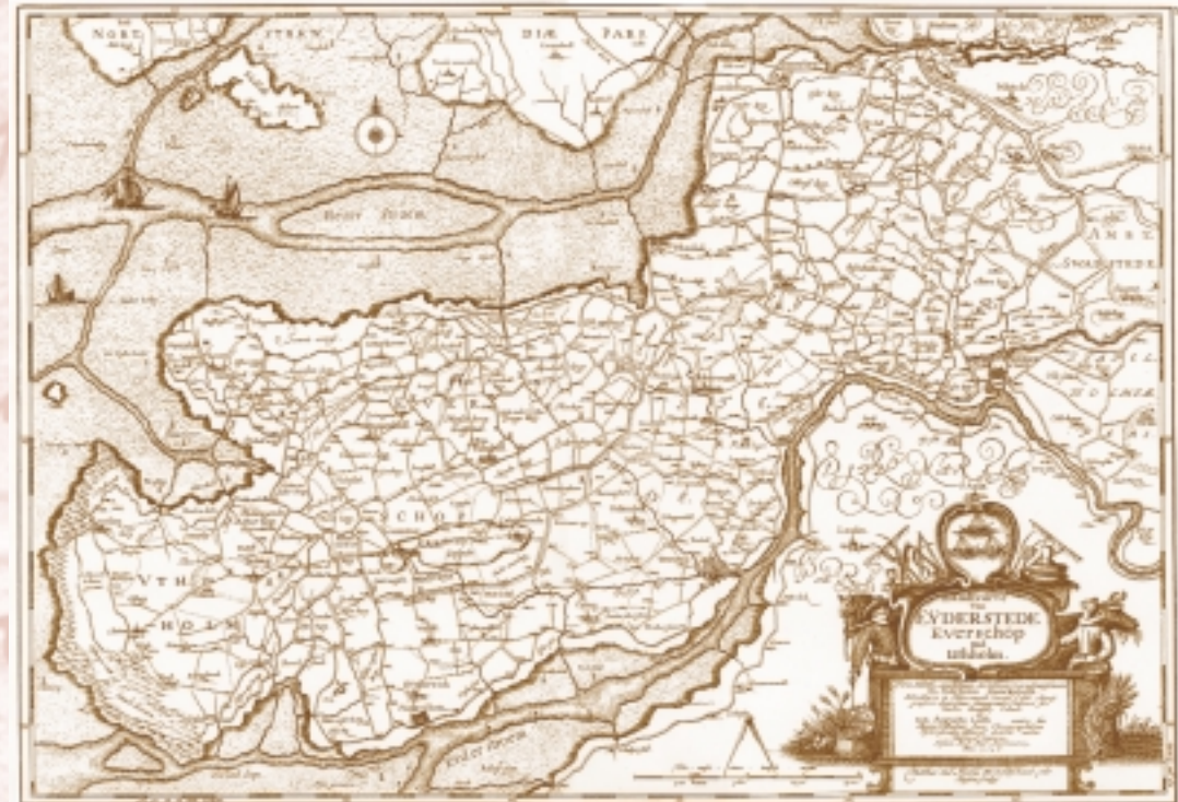
Das Amt Schwabstedt, Koldenbüttel und die Halbinsel Eiderstedt im Jahre 1648 auf der Danckwerth-Karte.

men Kammerrat befördert. Er war damit für die geheimen Angelegenheiten des Herzogtums und das Finanzwesen zuständig – heute wäre ein solches Doppelpostamt von Innen- und Finanzministerium kaum vorstellbar. Seine eigenen Aufzeichnungen vermitteln den Eindruck, dass er oft das Gefühl hatte, die Last der Regierungsverantwortung allein zu tragen. Zusätzlich führte er den Titel Kirchenpräsident und war damit auch für die kirchlichen Finanzen im Herzogtum verantwortlich.